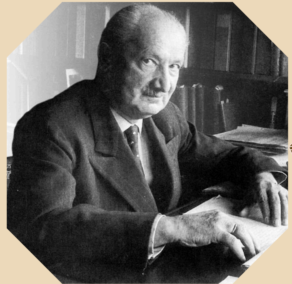
Martin Heidegger, 1889 жылы 26 қыркүйек — 1976 жылы 26 мамыр

2. Мартин Хайдеггер – Ол адамның болмысы мен әлемдегі орны туралы мәселелерге ерекше назар аударды. Оның «Болмыс және уақыт» (1927) еңбегінде Хайдеггер адам өмірінің шектеулігіне, өлімнің сөзсіздігіне және осы шектеулі өмір аясында өз болмысын түсіну қажеттілігіне назар аударды. Ол үшін философиялық сенім адамның дүниеде өзін қалай сезінетінін, қалай өмір сүретінін және өз болмысын қабылдауын сипаттайды. Ойлаудың трагедиясы осы шектеулермен күресуде көрініс табады.